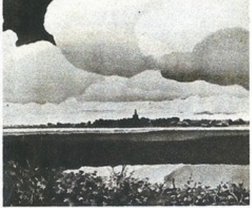
Dit is dan een van de geestrijke landschappen van Willem van der Ven.

Men merkt het wel: op deze wijze is de schilder kunst positiever dan de verbeelding van niet meer aan een stemming. Hierin ligt dan ook het wezenlijke van dit werk, waarmee telkens een greep wordt ge-