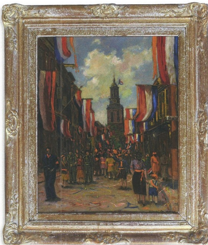
Het oorspronkelijke schilderij met lijst zoals het zich bevindt in de collectie van Stedelijk Museum Kampen.

De Zeeuwse Ad Moggré was in 1938 naar Kampen gekomen om te