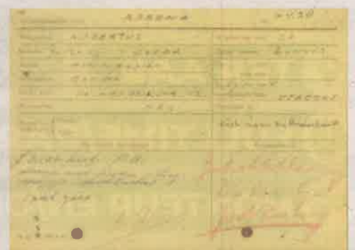
• Archief van de commissaris van politite te Gouda, arrestantenboek 1943

Hij concludeert dat gevangenschap niks is voor een mens. "Als we iemand afzonderen omdat hij tegen de gemeenschap heeft gehandeld, moeten we hem helpen een beter mens te worden. En dat kan niet tussen vier muren." En hij besluit met een wens: "Ik hoop dat ik met deze brief een klein radertje heb bijgedragen aan een betere wereld."